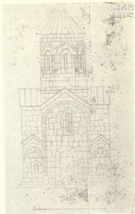
დასავლეთის ფასადი. რესტავრაციის პროექტი.

აღნიშნავს ძველზე არსებულ უჩვეულო მომენტებს, მაგრამ მათზე პასუხის ვაცემისაგან თავს იკავებს.