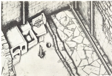
16-ე განთხარის სახლის ზურგის ნაწილის აღდგენა.