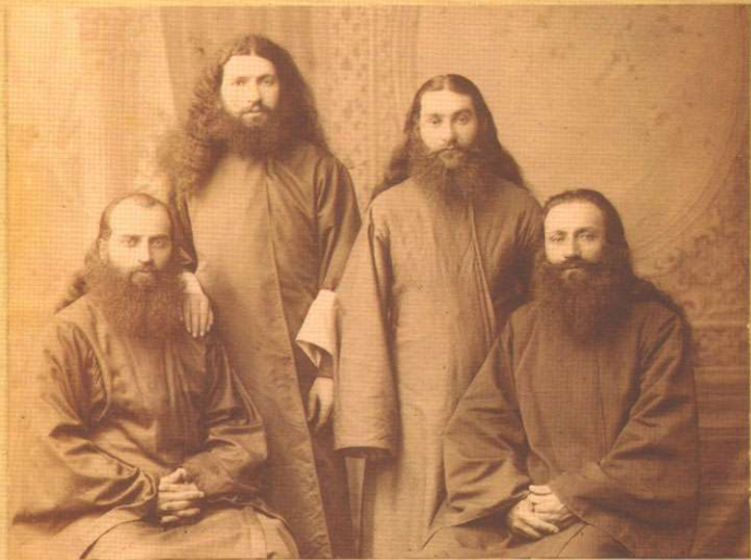
"კარბელაანი ყილო" სეალოტლოჭი